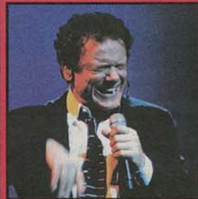
Massimo Ranieri incanta il Mancinelli e forse farà il bis