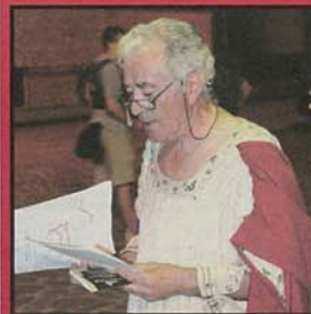
L'Accademia del Donca dà il via al gemellaggio con la Pro Ponte