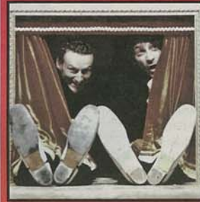
"Le nuvole" di Aristofane con Latella regista nei teatri dell'Umbria